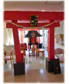
今年も登場☆職員お 手製の『つつじ神社』

旧年中は格別のお引き立てを賜り 心よりお礼申し上げます 今後もより一層の努力をしていく 所存でございます 本年も変わらぬご愛顧を賜りますよう お願い申し上げます